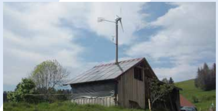
3,5 KW Anlage als Inselbetrieb mit Batteriespeicher