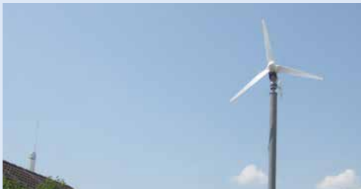
3,5 KW Anlage mit freistehendem Rohrmast