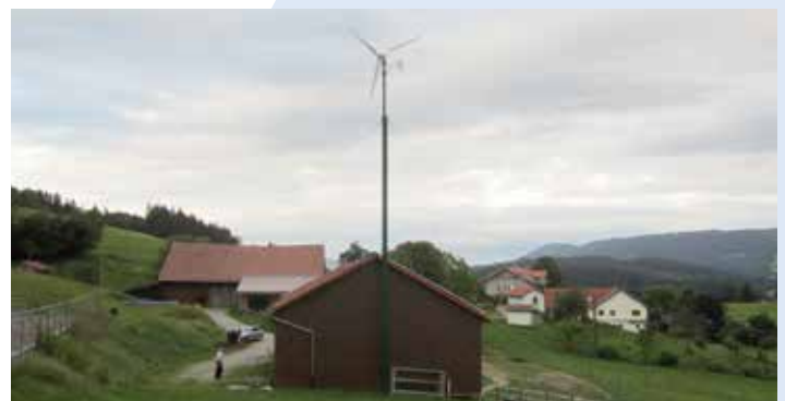
5 KW Anlage mit abgespanntem 15 m Mast