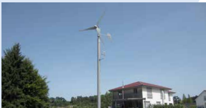
5 KW Anlage mit Rohrmast und integriertem Windmesser