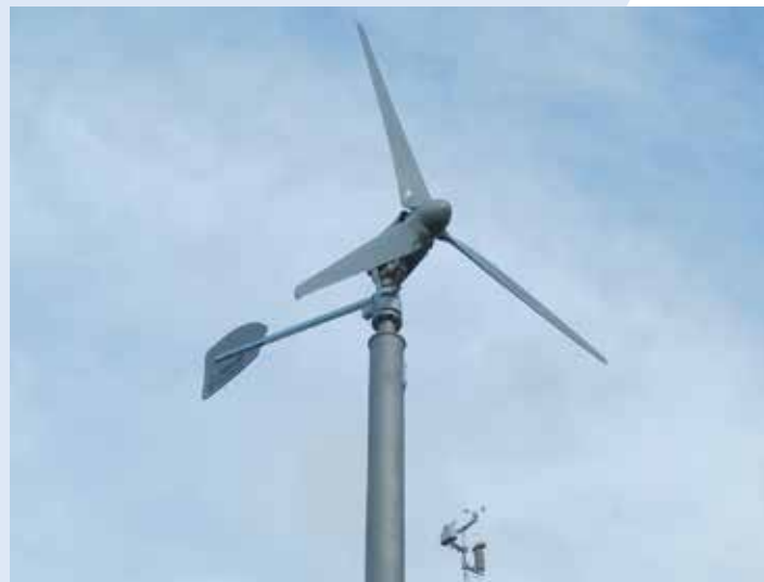
LEHNER 5,0 KS

Die LEHNER 2,5 KS , 3,5 KS und 5,0 KS besitzen ein kugelgelagertes Azimutlager und Schleifringe zur Stromableitung über das im Mast befindliche Kabel. Dadurch ist ein Verdrillen des Kabels im Mast ausgeschlossen.